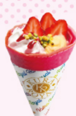
いちご Wクリーム クレープ \\380円\\