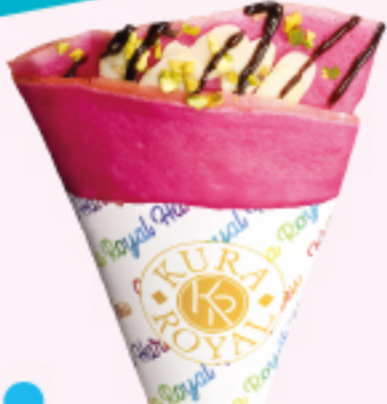
チョコレート ナッツクレープ \\280円\\