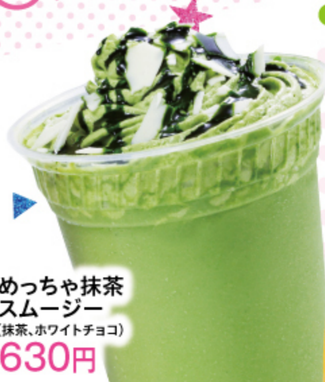
めっちゃ抹茶 スムージー (抹茶、ホワイトチョコ) 630円