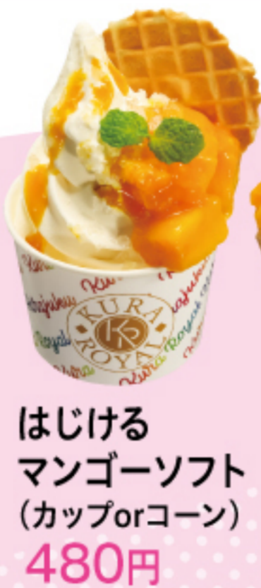
はじける マンゴーソフト (カップorコーン) 480円