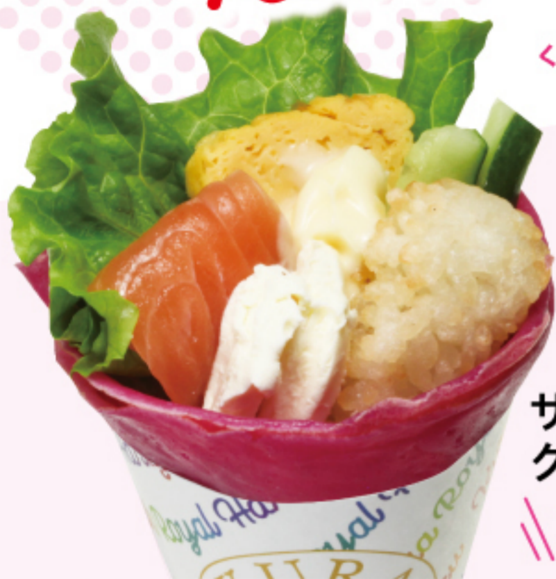
サーモン クリームチーズ \\380円\\

くら寿司スイーツのブランド「KURA ROYAL」から新たな情報発信基地としてスイーツ屋台を併設。 ここだけでしか味わえない出来立てのクレープなどが、なんと280円~ご堪能いただけます。