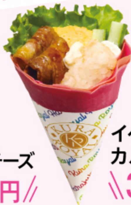
イベリコ豚 カルビ \\380円\\