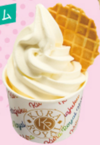
生乳ミックスソフト (カップorコーン) \\280円\\