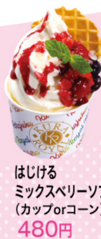
はじける ミックスベリーソフト (カップorコーン) 480円