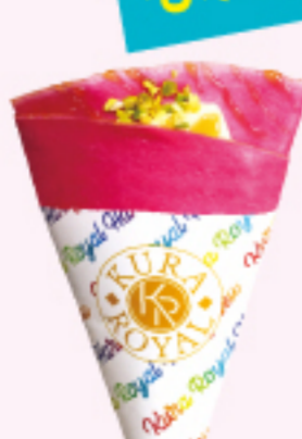
メイプルシロップ バタークレープ \\280円\\