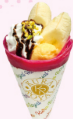
チョコバナナ Wクリーム クレープ \\380円\\