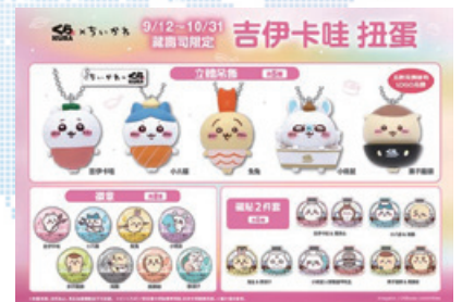
▲ ちいかわとのコラボキャンペーン

この結果、売上高265億98百万円（前年同期比5.9%増）、経常利益は11億59百万円（前年同期比26.6%増）となりました。