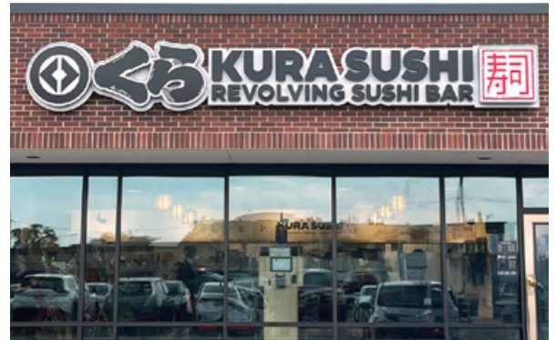
▲ ソルトレイクシティ店

この結果、売上高421億3百万円（前年同期比17.4%増）、経常利益1億14百万円（前年同期は経常損失10億41百万円）となりました。